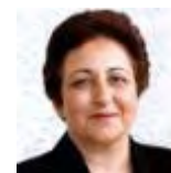
Shirin Ebadi IRAN