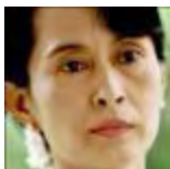
Aung San Suu Kyi BIRMANIA