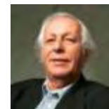
Samir Amin EGIPTO