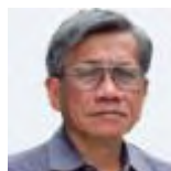
Walden Bello FILIPINAS