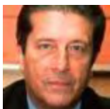
Federico Mayor Zaragoza ESPANYA