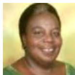
Gertrude Mongella TANZANIA