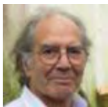
Adolfo Pérez Esquivel ARGENTINA