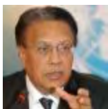
Anwarul Chowdury BANGLADESH