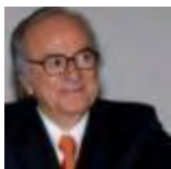
Boaventura de Sousa Santos PORTUGAL