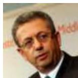
Mustafa Barghoutti PALESTINA