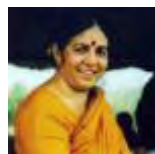
Vandana Shiva INDIA