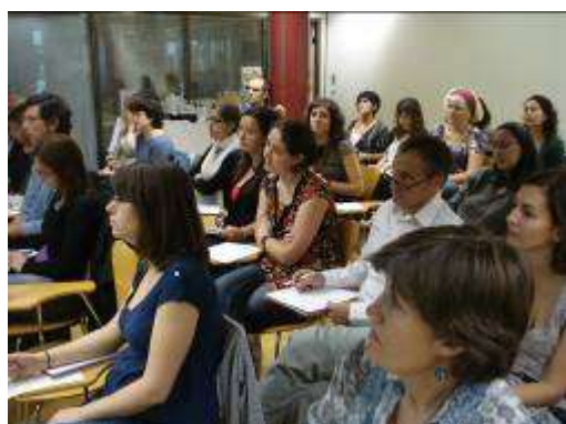
Diferents moments de la sessió de formació