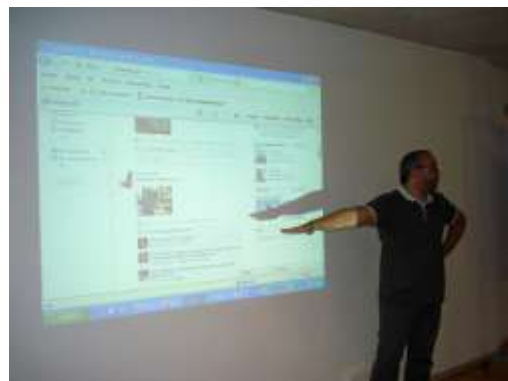
Diferents moments de la sessió de formació