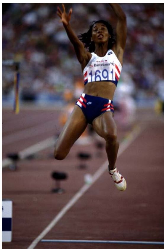
Imatges dels Jocs corresponents a l'Arxiu del COOB'92