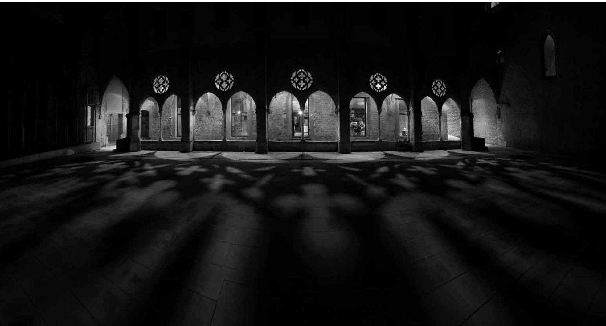
Claustre del Convent de Sant Agustí