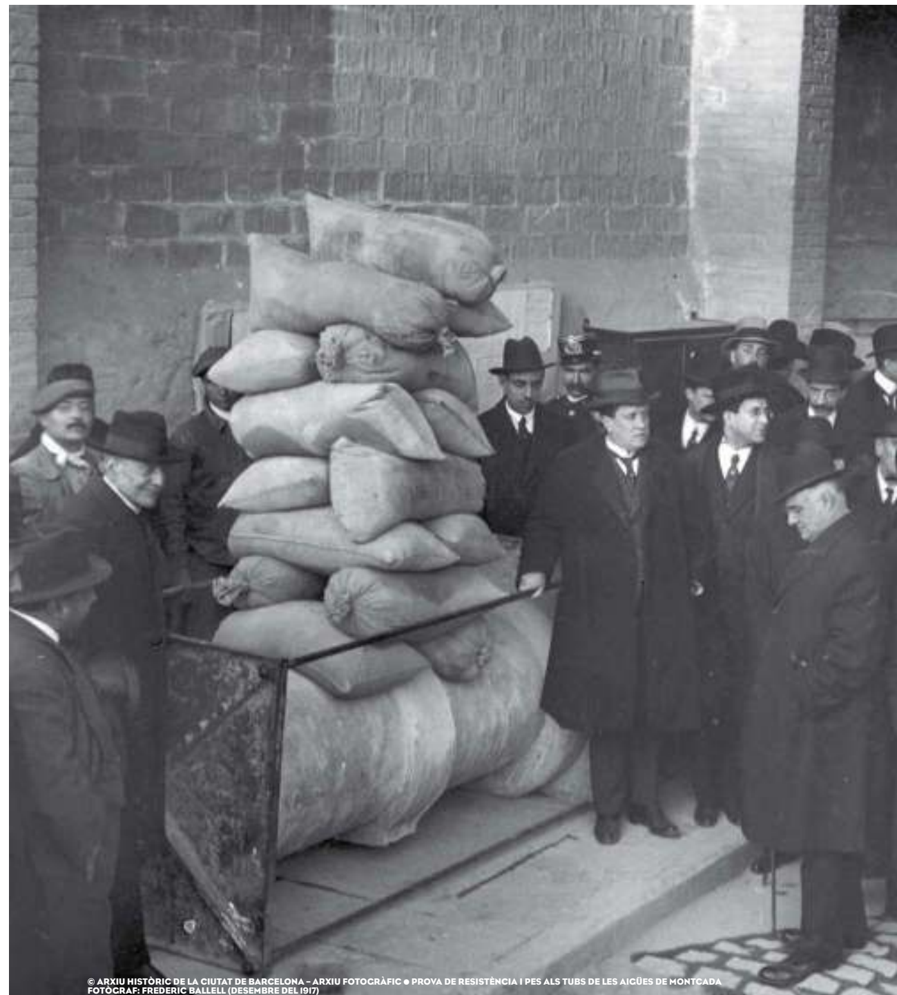
PROVA DE RESISTÈNCIA I PES ALS TUBS DE LES AIGÜES DE MONTCADA (DESEMBRE DEL 1917)