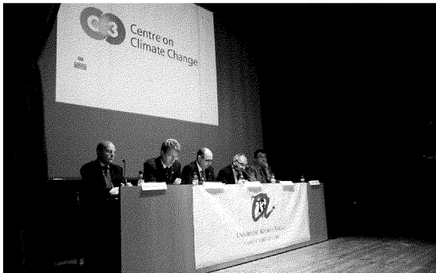
El rector de la URV va presidir la presentació del nou Centre en Canvi Climàtic (C3), amb seu a Tortosa.