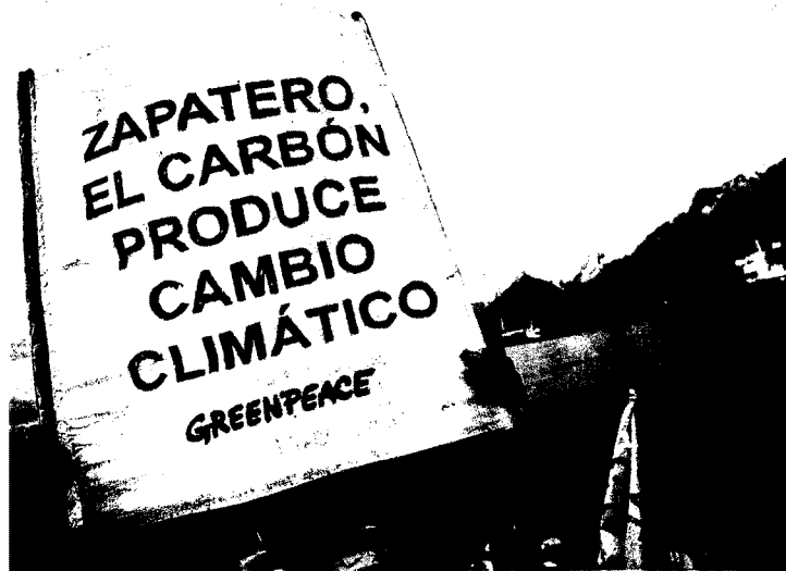
El director de Greenpeace, Juan López de Uralde, esta semana en el Ártico.

La ONG explicó ayer que Suecia, Reino Unido y Francia ya cumplen sus objetivos de Kioto y Alemania está a punto de hacerlo. Por el contrario, "España es el país de la UE que más se aleja de su objetivo". El año pasado, el estancamiento del sector de la construcción permitió una bajada considerable de las emisiones españolas, pero aún así, actualmente superan en un 42% las de 1990. Sin embargo, los datos del Observatorio de la Electricidad de WWF, publicado el martes, dan un poco de aire al discurso sostenible de Zapatero. En septiembre, las emisiones de CO 2 cayeron un 14% respecto al mismo periodo de 2008, gracias a la aportación de las energías renovables, so-