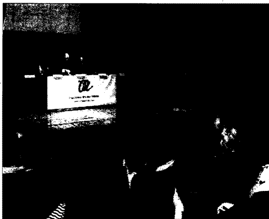
Un moment de la presentació, a l'auditori Felip Pedrell. LVDE

El nou Centre en Canvi Climàtic intentarà posar les arrels per convertir-se en un punt de referència en la reconstrucció i anàlisi del clima del passat. Una tasca ingent que passa per la recopilació de dades, la digitalització i també la re-