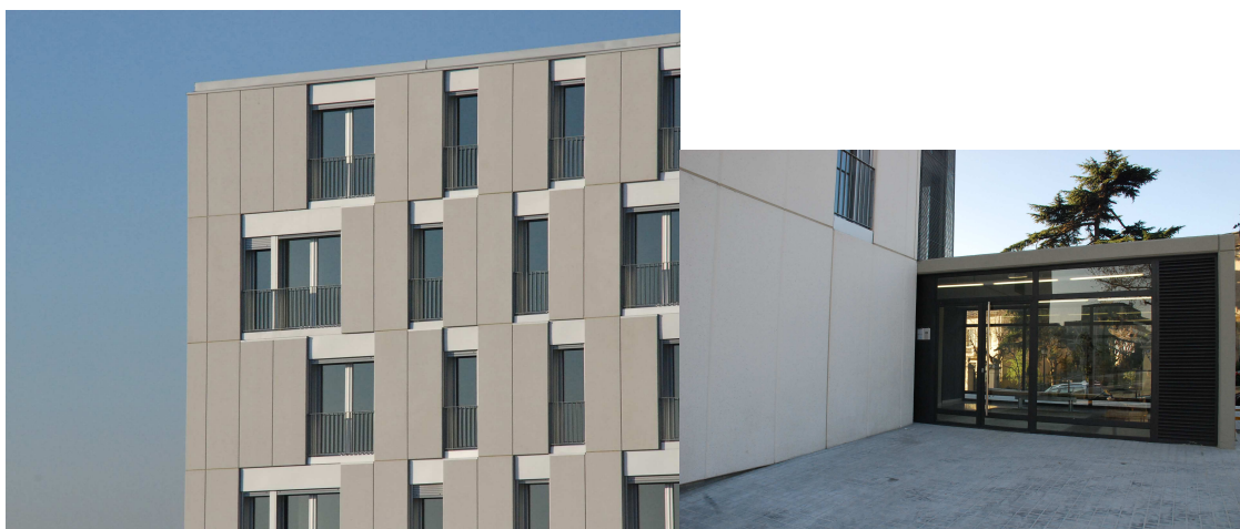
Fig. 4. Detalls de la façana i de l'entrada de la promoció a Alfonso Comín, 11-12.

En definitiva, aquesta promoció d'Alfons Comín, atén als exigents atributs i estàndards de qualitat i sostenibilitat amb què Regesa i l'Ajuntament de Barcelona promouen habitatge públic. Un esforç que ja ha estat reconegut amb el "Premio AVS a la mejor edificación sostenible de España" que va rebre el passat 5 de juny la promoció de 25 habitatges protegits de lloguer per a joves del carrer de Teodor Llorente (situada al districte d'Horta-Guinardó) i també integrada en el Pla d'Habitatge 2004-2007 de Barcelona.