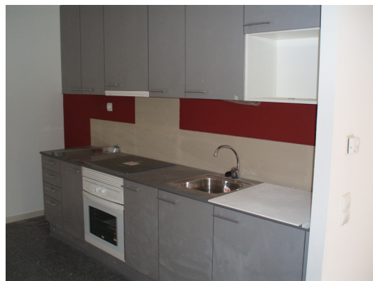
Fig. 2 i 3. Detall de façana i cuina dels habitatges al carrer de l'Encarnació.

En el marc del Pla de l'Habitatge de Barcelona i dins del Pacte Nacional per a l'Habitatge, l'empresa pública Adigsa ja ha lliurat a Barcelona -aquest any- altres dues promocions destinades a joves: al gener, a Sants-Montjuïc, 32 habitatges, i al febrer, al barri de Sant Andreu, 27 pisos, tots de lloguer i a preus d'entre 214 i 291 €. Amb els 53 d'avui, són 112 els pisos lliurats per Adigsa a la ciutat durant els quatre primers mesos de l'any.